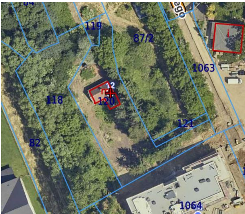
Rysunek 2. Obszar EC Dobrzańskiego

Istniejąca ciepłownia zlokalizowana jest w miejscowości Nowy Sącz przy ul. Dobrzańskiego 12, na działce ewidencyjnej nr 120, obręb 111. Teren inwestycji znajduje się w granicach administracyjnych miasta Nowy Sącz i objęty jest miejscowym planem zagospodarowania przestrzennego „Nowy Sącz – 55”.